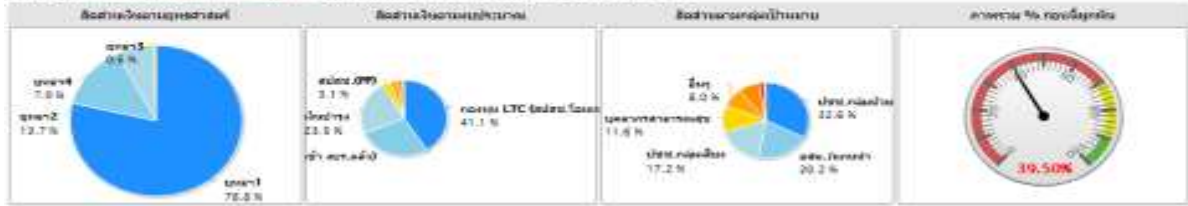
ร้อยละตัวชี้วัดที่ผ่านเกณฑ์ (ตัวชี้วัดทั้งหมด)

แสดงข้อมูล : ตัวชี้วัดความสำเร็จของภาพรวม :: ภาพรวมภาพรวม 2,981,935.88 บาท (ก่อนปี 1,146,402.88 บาท)